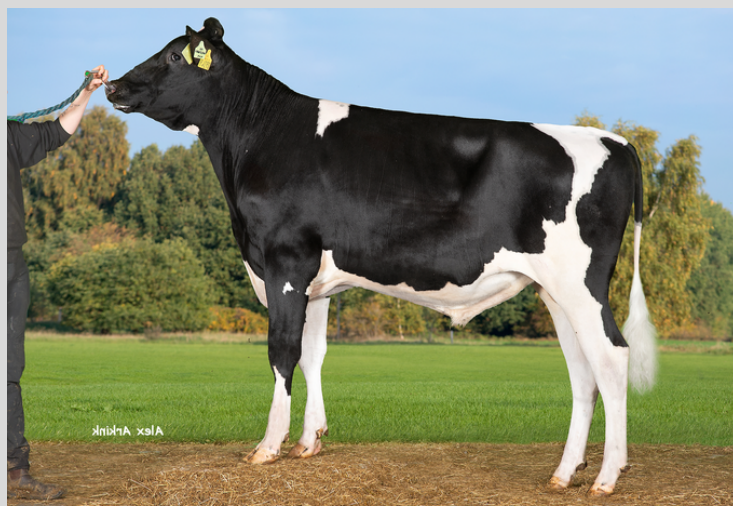
Ny spændende tyr VH Nalegro