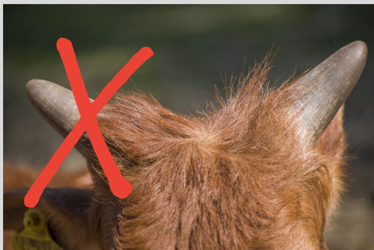
Horn eller ikke horn - hvad vælger du i fremtiden???

end en pollet kvie, er trods alt en merværdi svarende til 750 kr., hvilket er af langt større værdi end hvad det koster at afhorne en kvie. Bedste aktuelle tilbud blandt PP-tyrene er VH San PP RC (Sauna PRC x BuilderP) fra Tirsvad Holstein. Højt Y-indeks på 130, kropsstærke køer og tiltalende malkeorganer. Eneste mi-nus er, at han kunne være lidt bedre for frugtbarhed og sparet foder, men på ingen måde på et niveau hvor du bør holde igen. Endelig har han også en lidt anden afstamning. Det er værd at bemærke, at i kulissen står to andre unge PP-tyre fra Viking Genetics på spring til at komme ind på scenen, nemlig VH Savor PP og VH Spot PP , respektive med et NTM på +34 og +32. Begge er noget unge så du skal nok hen på sommeren inden de er til rådighed.